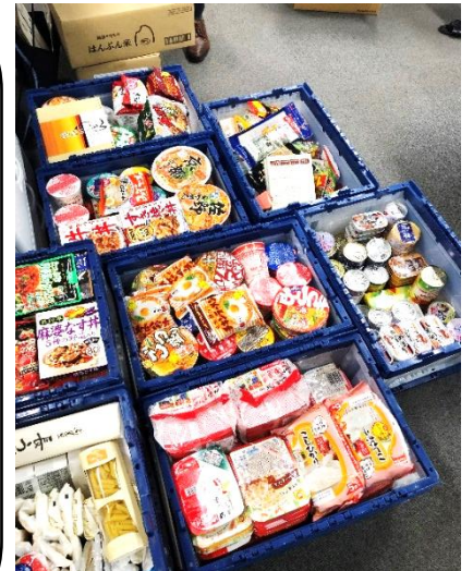
↑昨年寄付頂いた食品